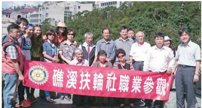
華梵大學職業服務

接著參觀學校的文物館，計有四個展區：中華文物區、佛教文物區、書畫區、特展區。建議沒去過的人能去參訪一下，真的