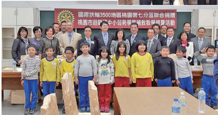
小朋友們特別準備感謝小卡片轉贈各社友合影

扶輪社一直推動各項服務與資源挹入計畫，希望能彌補政府資源不足及發揮雪中送炭的精神，提供弱勢學生補救教學及適性多元學習的機會，提高學習效果，增進學習成功的信心。