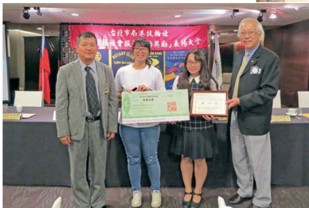
15-16 年度大專院校社會服務活動獎勵第一名，恭喜台東大學藍鯨基層服務社

初發函開始，即陸續接到學校或同學的詢問電話，我們也藉由舉辦此活動的機緣，介紹與推廣「雖然我喜歡，不是都可以」的心靈提升概念，並邀請社團將此概念融入社會服務活動當中，藉此推廣深化，讓年輕的族群能夠有向上提升的心靈依託。南港社以此拋磚引玉，發揮一己正向社會影響力，多年來從不間斷。