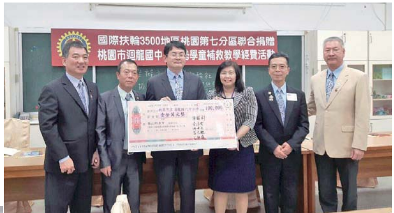
桃園第七分區助理總監、福臻、福興、福德、福豐社社長代表捐贈經費合影

為了幫助弱勢課業落後的兒童，104 年 12 月 11 日 3500 地 桃園第七分區福臻、福興、福德、福豐社，聯合捐贈了 10 萬元給桃園市立迴龍國中小，讓弱勢家庭的孩子們，透過老師的個別指導或小團體輔導，將落後的課業追趕上來，