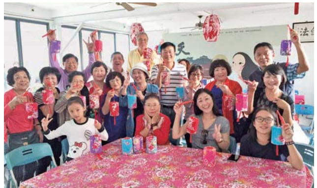
「山客家花布燈籠館」DIY 活動

11 月 28 日一早滿載 40 名社友、寶眷之巴士由花蓮兒童圖書館前廣場出發，首先抵壽豐「蜂之鄉生活館」，受到友社社友老闆款待。中