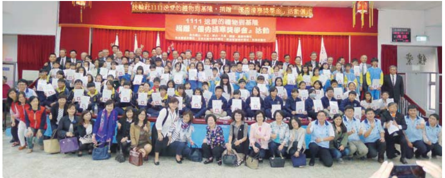
十分區全體參與社友、寶眷與 90 位受獎學生合影

11 月 11 日十分區聯合舉辦「1111 送愛的禮物到基隆，捐贈優秀清寒獎學金活動」，由本社主辦。今年適逢國際扶輪創立 111 年，所以 3520 地區十分區六社（本社、中正、華山、大直、關渡、樂群）及雙溪社特地選在 11 月 11 日這一天，把愛的禮物送到基隆，來到基隆舉辦頒發「優秀清寒獎學金」捐贈儀式，服務社會、造福人群。感謝基隆市政府協助提供需要幫助的學生名單並促使今天這個有意義的活動能夠如期舉行。此活動捐贈基隆地