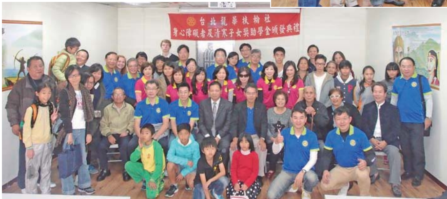
復興獎學金頒獎典禮