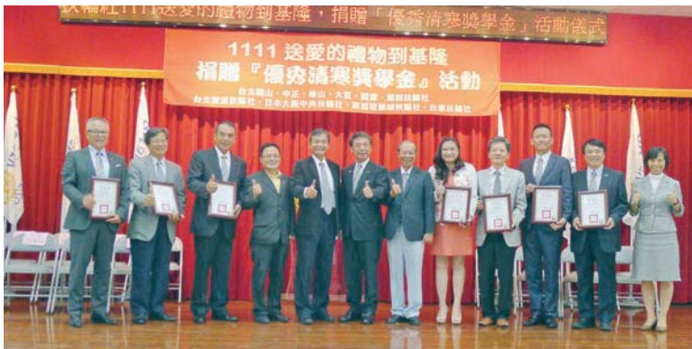
基隆市政府回贈各社感謝狀

如同大家所知，在台北生活圈中，台北市和新北市的政府預算編列補助資源豐富，唯獨基隆