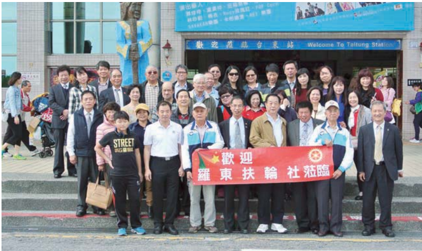
台東兄弟社熱情接待本社訪問團

台東社 Mitsubishi 社友、PP Alumi、PP Medicine 接我們去富岡港口餐廳，3510 地區總監 Gas 也一起用午餐，魚蝦海鮮菜色可口。之後進駐 Builder 經營的富野渡假酒店，5 時半前往 Salonpas 社友開設的東霸王餐廳參加台東社社慶。