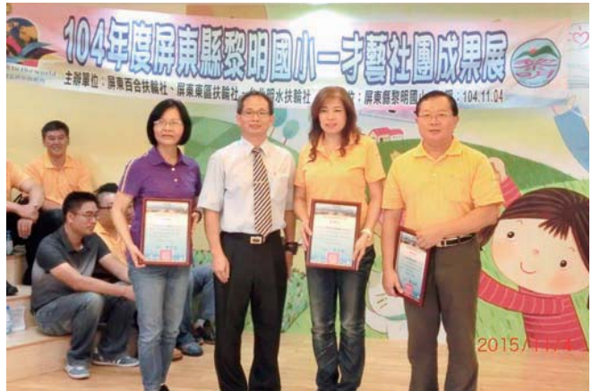
校長致贈三社感謝狀