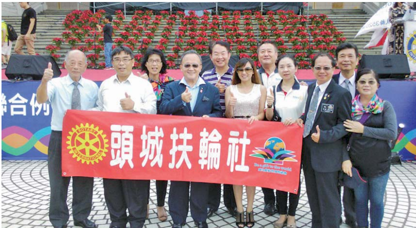
國際扶輪前社長黃其光先生與本社社友合影

的熱情與執著。在例會中特別敦請臺灣之光，前國際扶輪社社長黃其光先生作專題演講，講題：光耀扶輪——RI 社長之旅分享，例會結束後，舉行聯誼晚會與餐敘，會中各社安排精彩節目表演，使得晚會充滿歡樂與溫馨，社友間彼此交流熱絡，大家分享工作服務成果，夫人們互動密切，相互關懷，這就是扶輪之可貴，除了彼此的聯誼，更重視服務的分享，讓各社友誼得以長存。例會在大家依依不捨中結束，這次的聯合例會，可謂扶輪家族們一個難忘的聚會，期待很快大家再相聚。