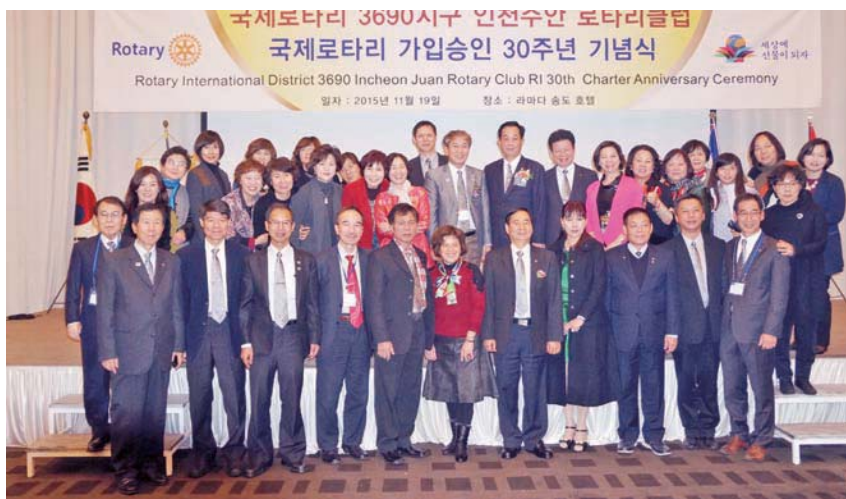
仁川松島華美達酒店參加朱安姊妹社授證 30 週年紀念慶典

11 月 19 日下機後，我社一行 22 人專車前往 HAK-IK 高中參加全球獎助金計畫捐贈儀式，此計畫向 RI 申請 49,000 美金幫助學生取得製作糕餅點心技術與執照，畢業後有一技之長，所以標題叫「Dream Job Go, IPP School 當場說明我社高興參與的立場與經過，獲熱烈掌聲。朱安社在仁川一社區公園裡設立一紀念碑紀念今天，上刻中華民國國旗與羅東扶輪社字樣，可謂莊嚴。