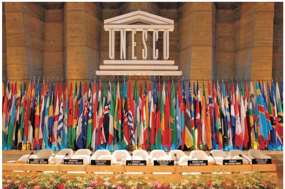
聯合國教科文組織年會

的黑暗期，但是在 1945 年戰爭結束後的數年間，這些休眠中的扶輪社在歷經戰爭的洗禮之後，不但很快的恢復了運作，更為活躍穩定，而且發展更為迅速。目前全世界 120 萬扶輪社員也透過五大服務的途徑，廣納了更寬闊的領域，從各種不同的層面和方式，為世界社會成就了很多卓越的貢獻。希望在此世代交替的時刻，有更多的新世代投入我們的行列，繼續傳承扶輪的崇高理念，為人類的福祉和世界和平盡一己之力。