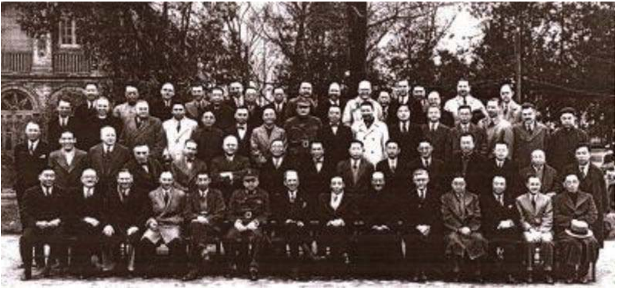
南京扶輪社成立大會 (1933)

在世界各國都設有非官方的民間組織，為了全世界的永續和平，默默的從教育、科技及文化的途徑推動國際間的親善與瞭解。