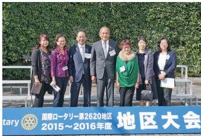
11月7日中午為山梨縣日日報專訪拍照