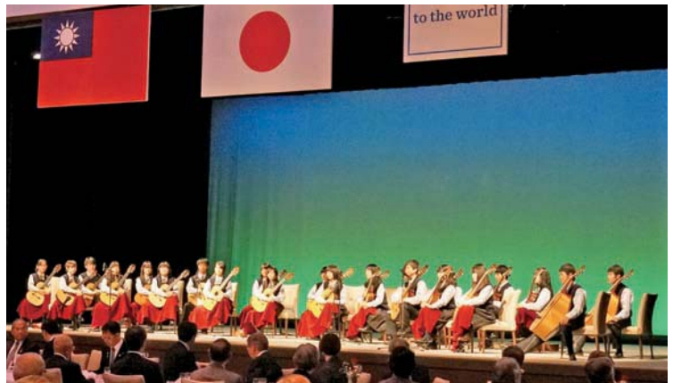
11月6日 2620 地區北斗高中表演

下午 2 時半，聯誼餐會活動開始，席間與多位日本扶輪重量級前輩分享自身扶輪經驗，包括擔任 RI 扶輪理事的 Seiji Kita (北清治)、RI 訓練師 (2013-15) Shuichi Kobunai (小船井先生) 和 Toyoaki Fujibayashi (藤林先生)，受益良多。