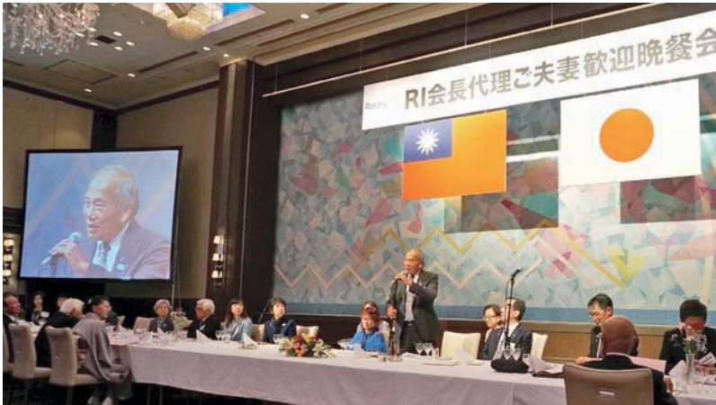
11月6日 RI 社長代表 PDG Kent 晚餐會問候

招待甲府葡萄酒莊生產的五種白酒，從清淡喝到濃醇，每一種展現不輸法國葡萄酒的香氣和口感，令我們印象深刻。