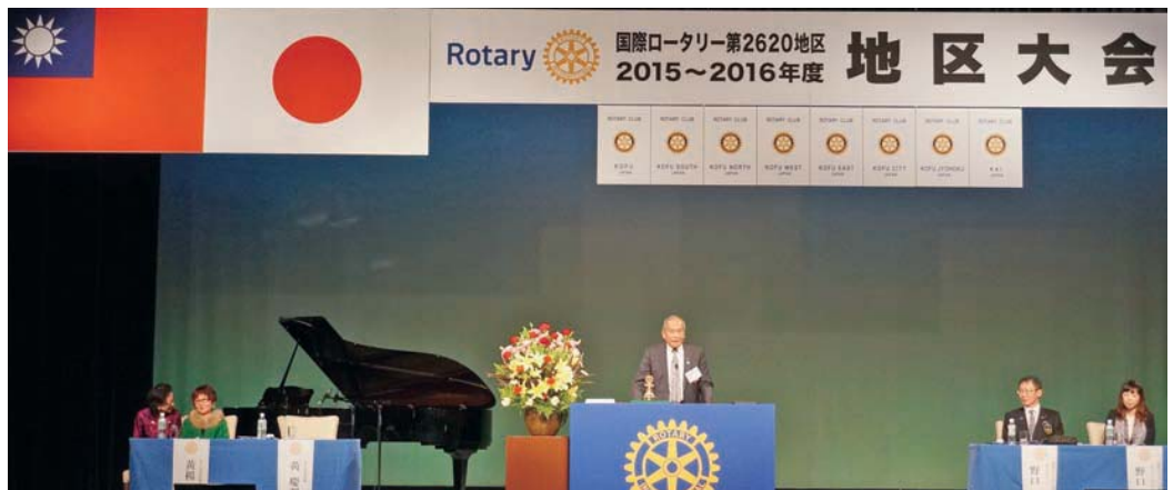
11月7日 RI 社長代表 PDG Kent 演講實況