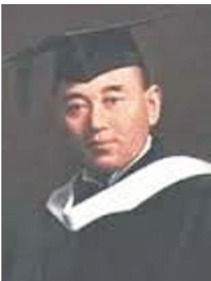
米山梅吉留美時期

日本扶輪創始人米山梅吉年輕時奉派留學美國，他在滯美的八年期間廣泛地涉獵了西洋文學、政治及人文哲學等領域的知識，並取得文學碩士學位，對於他畢生致力於扶輪志業有很大的影響。在他的著作「看雲錄」(1938)一書裡，描寫了一些國內外名人物的軼事，其中他很細緻地介紹了他最推崇的三