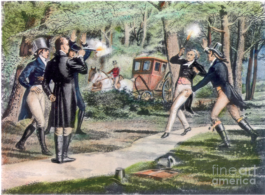
亞歷山大·漢彌爾頓與政敵的決鬥