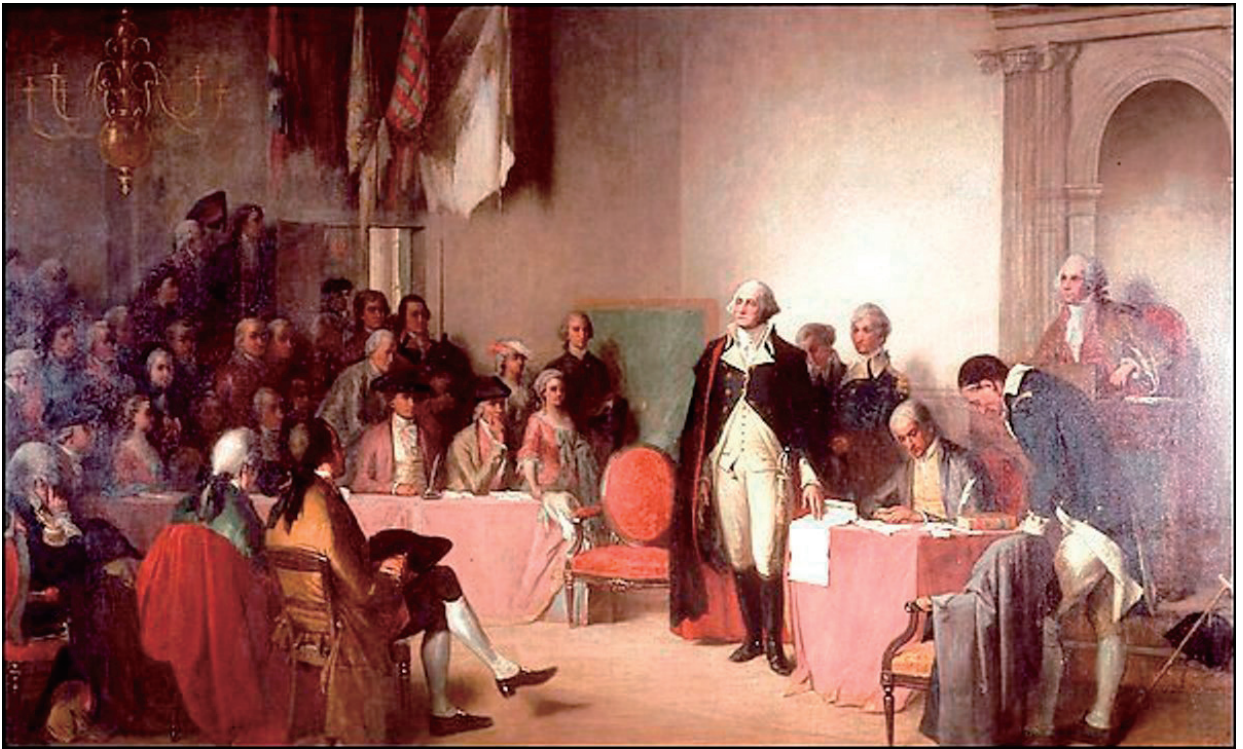
喬治·華盛頓起草獨立宣言