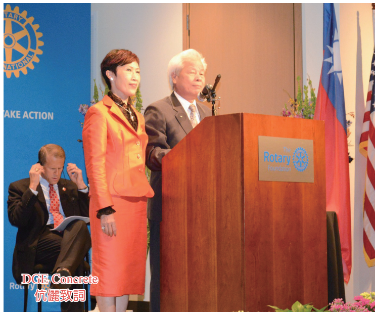
DGE Concrete 伉儷致詞