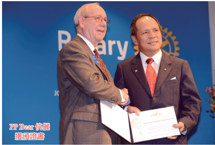
PP Bear 伉儷 獲頒證書