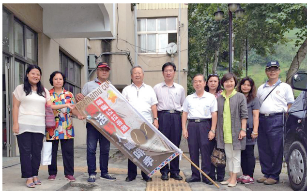
樂野文化健康站前合影