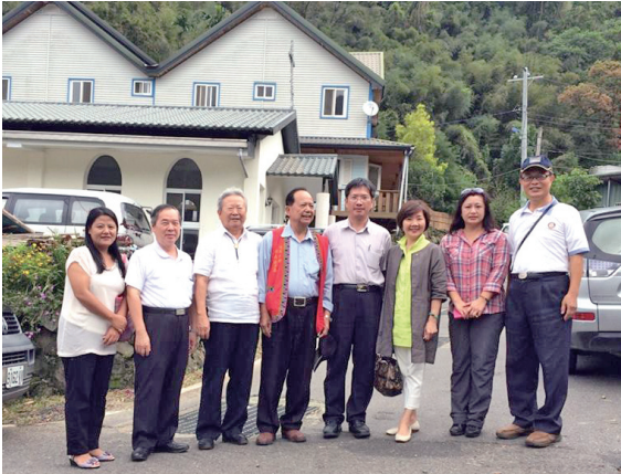
與阿里山鄉鄉長、縣府科長及原民會等合影

9月3日一大早，率本會秘書長及兩位副秘書長搭高鐵前往嘉義，這是本會承辦全國原住民部落文化健康站改善計畫第三階段的實地訪察，目標是阿里山鄉的六個站。