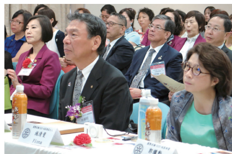
地區總監 Venture 偕夫人仔細聆聽

2015 年 9 月 24 日上午 9 時假台大校友會 館四樓會議室舉行捐贈「乳房及婦科雙用超音