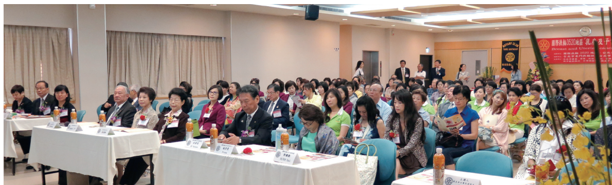
乳房及子宮癌論壇