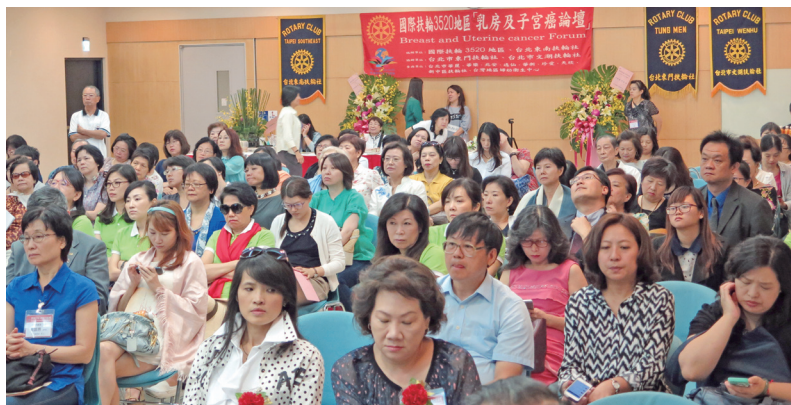
女性社友出席踴躍

作防癌及健檢使用。子宮頸防癌 抹片檢診車雙管 齊下與乳房超音 波雙合一，一次 可做雙項檢診， 便利民眾。此項 捐贈設備不像以 往的超音波攝影 機器「體積龐 大」，無法裝置於晃動的輕型車輛。而且便利 於移動深入偏遠山區。確實為了婦女健康把關 更上一層樓。