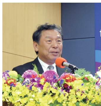
地區總監 Venture 致詞

買高規格輕型移動式乳房及子宮（婦科）超音 波影像系統贈送予國內最負盛名及績效之台灣 地區婦幼衛生中心以供巡迴城鄉或偏遠地區