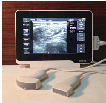
捐贈之超音波設備