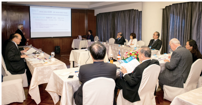
總監當選人 DGE Concrete 提出報告