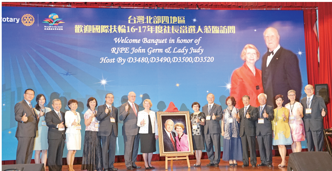
DGE 伉儷贈禮 John Germ