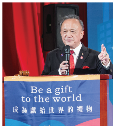
國際扶輪前社長黃其光 Gary 致詞

報告事實上我們正積極聯合各扶輪社一起推動許多跨地區性乃至全台灣的活動，承諾我們將一步一腳印的實踐扶輪的計畫延續扶輪的脈絡，讓台灣成為獻給全世界