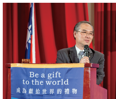
DGE Peter 致謝詞

任國際扶輪社長，也向 RI 社長當選人聲明台灣扶輪社友將時時刻刻支持他，作好準備迎接扶輪基金會百週年的活動且願意與社長當選人一起承擔擔任國際扶輪社長期間所遭遇的挑戰，並且簡單說明了當天早上 DGE 同學們已經向他報告了年度目標訂定與策略發展，說台灣目前所有的扶輪社員都已熱情付出，為擴展新的里程碑而努力，其中兩點包括達成社員 4 萬人的目標與達成華語成為國際扶輪官方輔助語言，所以他說需要加強與國際扶輪更多的互動，最後他重申在他任內全力支持國際扶輪達成訂定的目標，相信許多社友會在明年首爾