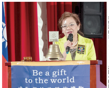
DG May 致歡迎詞