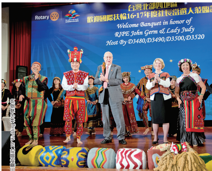
RIPE 伉儷與原民舞者同樂

第七天 10 月 6 日早上澤恩伉儷參觀漢林環境保護科技股份有限公司，中午出席 3510 地區前總監協會為他們舉辦的歡迎午宴，餐後轉往綠建築圖書館參觀服務計畫，並於晚間前往左營漢神小巨蛋會館出席 3460、3470、