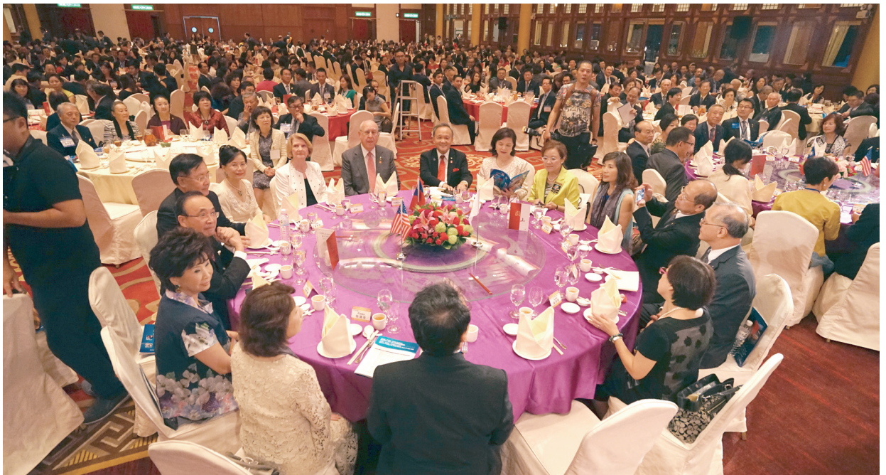
眾多扶輪社友齊聚一堂歡迎 RIPE John Germ 伉儷訪台