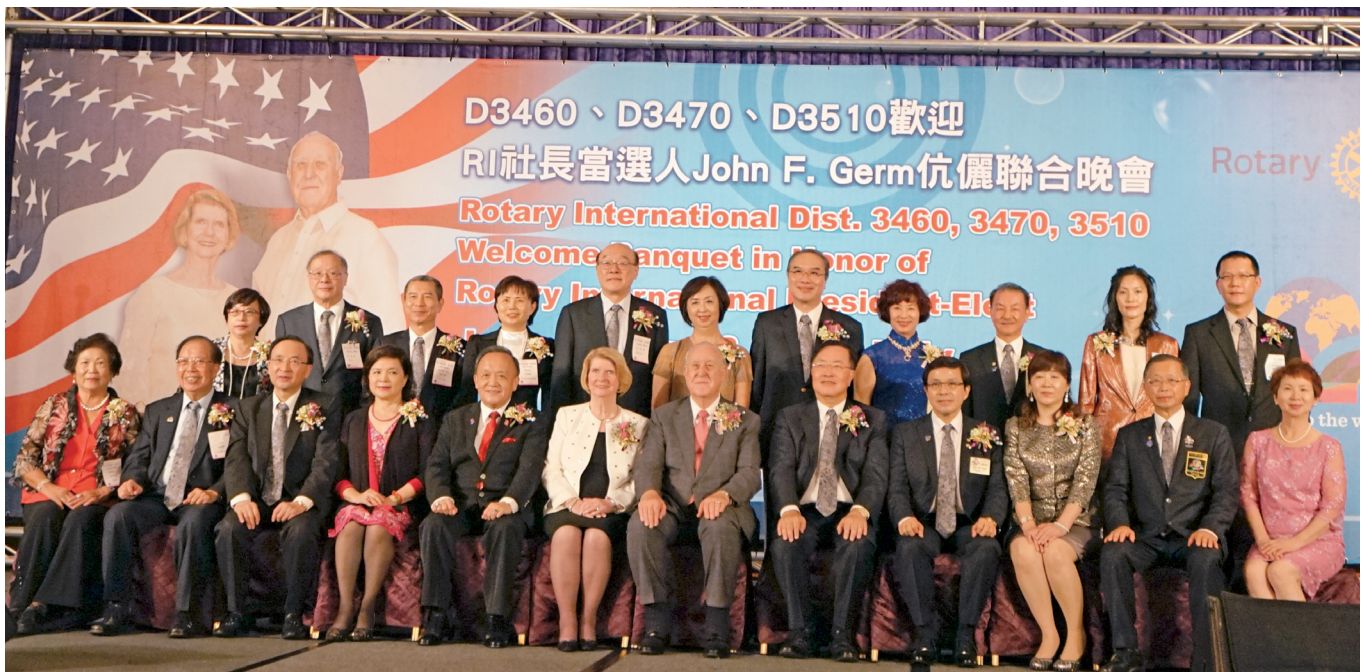
DG、DGE 與 RIPE 及扶輪領導人合照