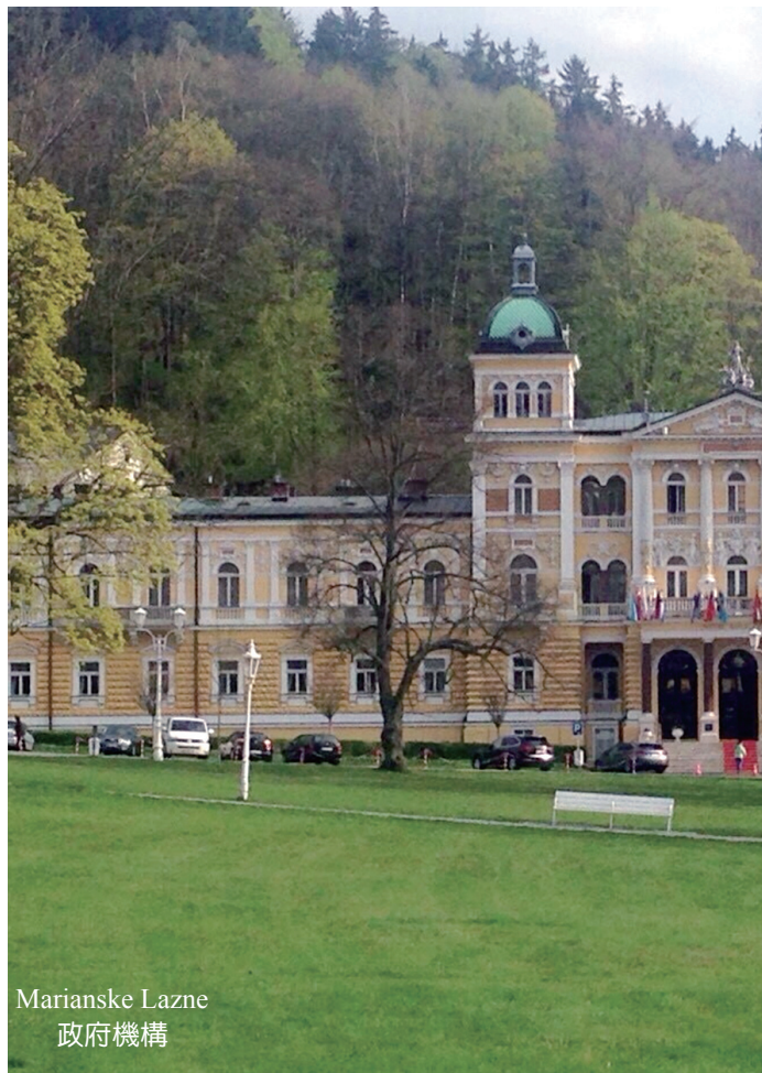
Mariánské Lázně 政府機構

捷克、奧地利兩國避過戰爭的摧殘，及沒有地震的破壞之故，因此各時期的建築（古蹟）均被保護得相當完整，許多地區被聯合國教科文組織列為世界遺產保護之，例如捷克的庫倫洛夫（Krumlov）城堡，以歌德式