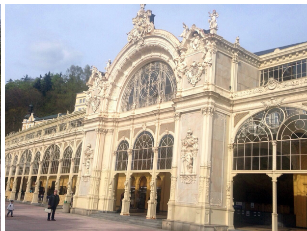
Marianske Lazne 溫泉迴廊