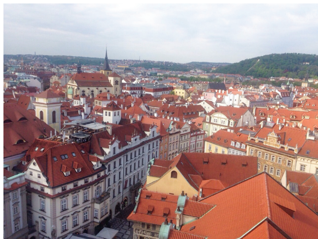
舊市政廳高塔俯瞰市街

歐洲是西洋古文明最重要發祥地之一，舉凡人文、藝術、音樂、建築、景觀等均執世界牛耳，無人能望其項背。人文薈萃、人才輩出、至今仍舉世聞名，令世人如數家珍般、在