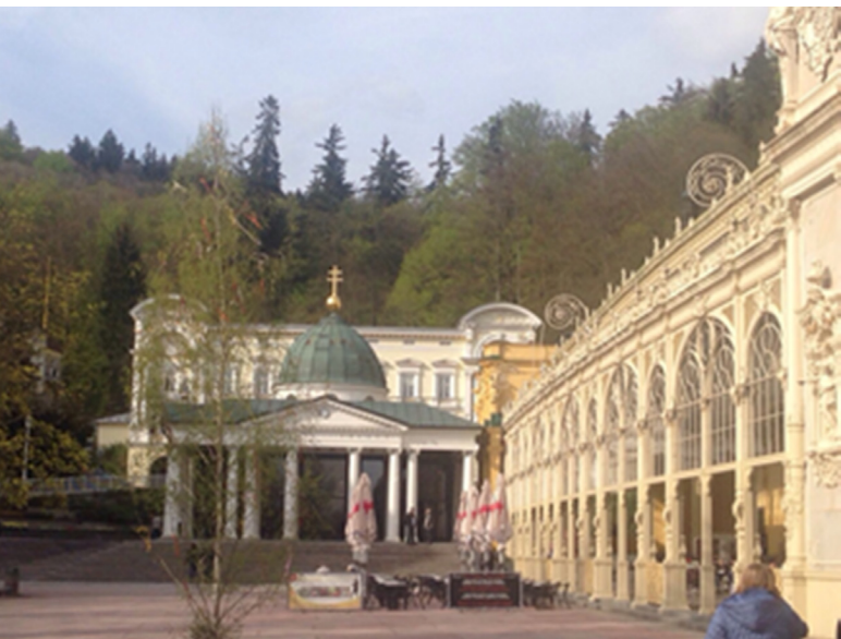
Mariánské Lázně 溫泉迴廊

有時光倒流之感，更值得一提就是在維也納音樂廳享受一場身歷其境的交響樂饗宴，此機遇難得極了。