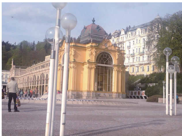
Marianske Lazne 溫泉迴廊

這趟有幸能親自目睹音樂神童莫札特的故居，烈日照耀下貝多芬一代宗師的青銅雕塑更顯得氣勢格外雄偉、睹物思人、緬懷先哲、更