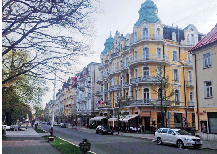
Mariánské Lázně 街景

勵國人生產，母親有三年之育嬰假，父親則有一年的陪嬰假，讓你能專心照顧嬰幼兒，國家養你到 18 歲，失業了只要你提出申請，國家每月會給你 600-800 歐之生活補助費，聽完導遊說完，大家異口同聲說我要移民去。