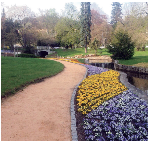
Mariánské Lázně 公園

勵國人生產，母親有三年之育嬰假，父親則有一年的陪嬰假，讓你能專心照顧嬰幼兒，國家養你到 18 歲，失業了只要你提出申請，國家每月會給你 600-800 歐之生活補助費，聽完導遊說完，大家異口同聲說我要移民去。