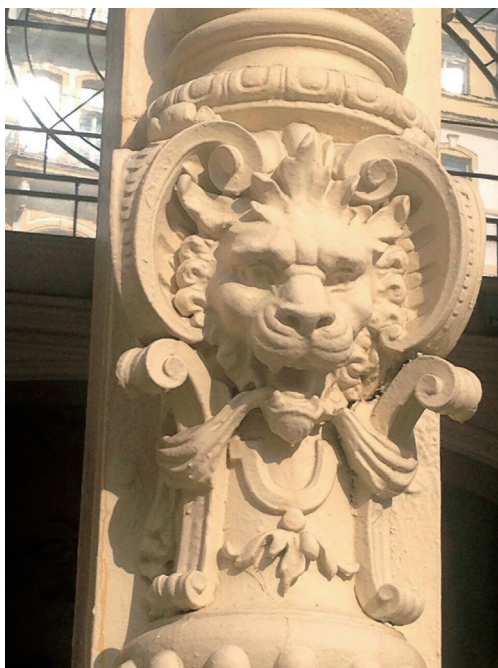
溫泉迴廊外牆浮雕

（Gothic）的型式建在山頭，是歐洲最美的中古小城之一，伏爾塔瓦河蜿蜒而過，悠緩而寧靜，從城堡俯瞰小鎮，紅瓦白牆的屋子在陽光照耀下展露出迷人的風情，更在遠處丘陵蒼翠的樹林及碧綠草原襯托下，構成一幅美麗的圖畫，時光彷彿停留在