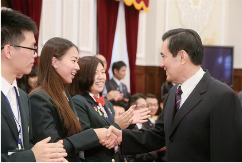
馬總統與派遣學生一一握手