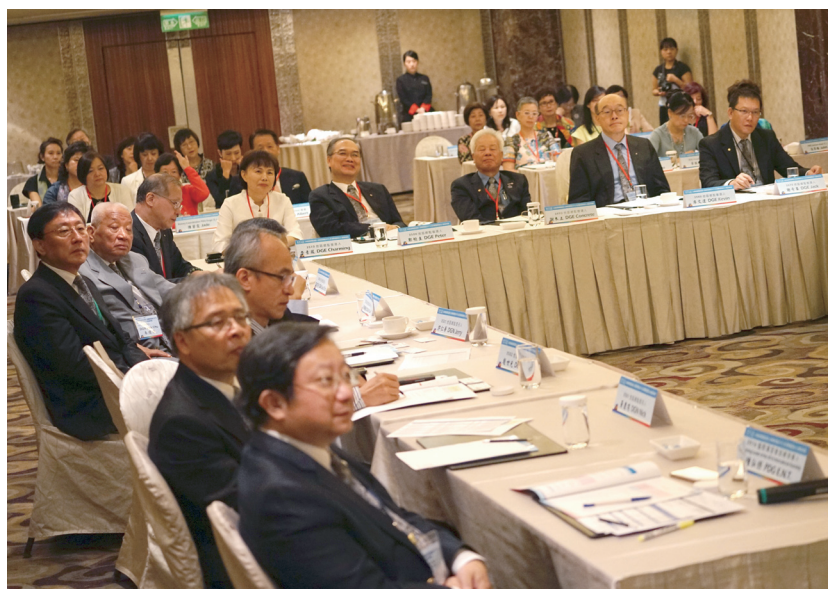
DGE、DGN 與寶眷們專心聽講

菲律賓馬尼拉 Sofitel 飯店舉行的 6B、7A 與 10B 地帶研習會前的地區總監當選人訓練研習會與 2016 年 1 月 17-23 日七天在美國聖地牙哥君悅飯店召開的國際講習會。為幫助他們先做好充分準備，2015 年國際扶輪訓練領導人 RI Training Leader 梁吳蓓琳