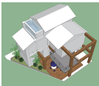
多自然採光概念設計；頂部空照採光區域