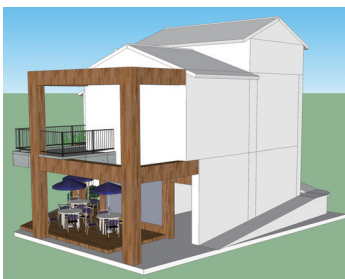
入口處頂板雨遮與銜樑設計；自然形成遮陽與外部玄關概念