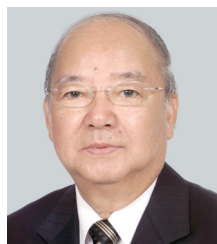
委員 PDG Letter 張信