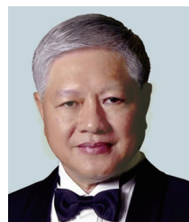
委員 PDG Amko 黃金豹