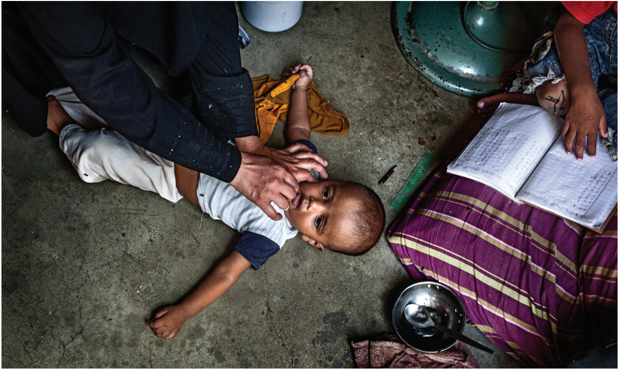
在喀拉蚩郊外一個動盪不穩社區中的一名兒童正在接種小兒麻痺疫苗。