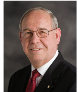
扶輪基金會 保管委員會主委 柯林根史密斯

我們必須像扶輪社員以往一樣採取行動，趁勝追擊並徹底撲滅小兒麻痺。我們達成這個目標的機會之窗稍縱即逝，一旦失敗，不久的將來就可能得面臨一年多達 20