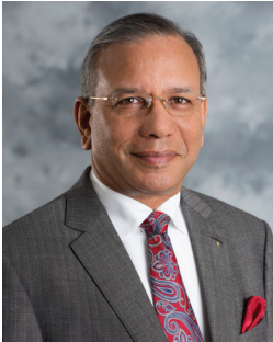
國際扶輪社長雷文壯