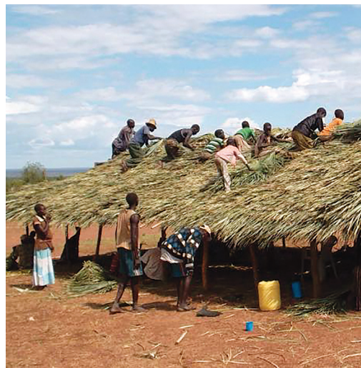
儘管南蘇丹的戰亂集中在邊界地區，但相對平靜的內陸地區仍飽受經濟動盪與基礎設施荒廢毀壞之苦。

這項計畫一路上遭遇了許多有形與無形的障礙。這些村落位於洛皮特山脈（Lopit Hills）東北部的深山裡，只有一條道路通往最近聚集的社區，許多村民得走上 3 天才可到達。當 5 月至 10 月雨季來臨時，建築材料及救濟物資幾乎無法送進山裡，加深了這個