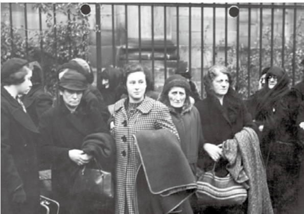
1938 年 10 月末被德國驅逐的波蘭籍猶太人 維基百科

英國作家馬克·奧尼爾 (Mark O'Neill) 也在其著作《異地吾鄉：猶太人與中國》(Israel and China) 一書中描述 1938 至 1940 年間中華民國駐奧地利維也納的總領事何鳳山，目睹猶