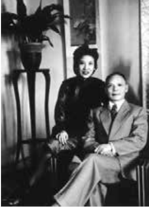
何鳳山夫婦