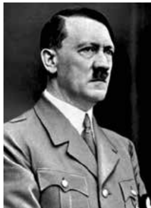
阿道夫·希特勒 維基百科