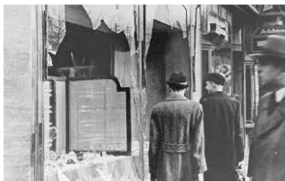
水晶之夜後損壞的猶太人店鋪

1938年11月9日夜至10日凌晨，德國突然爆發納粹黨員與黨衛隊襲擊境內猶太人及其商店的「水晶之夜 Kristallnacht」事件，開啟了納粹有組織屠殺猶太人的序幕。猶太人為避免被送進集中營，乃紛紛逃離歐洲。於是成千上萬的猶太人爭先奔走於各國使館申請簽證，因而被稱為「生命的簽證」。