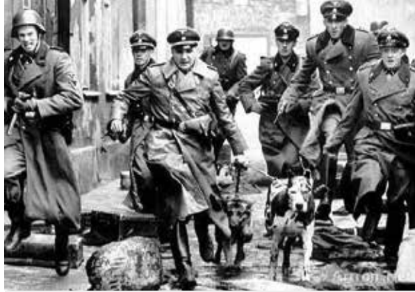
德國納粹的大搜捕