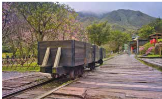
運煤輕便軌道遺跡