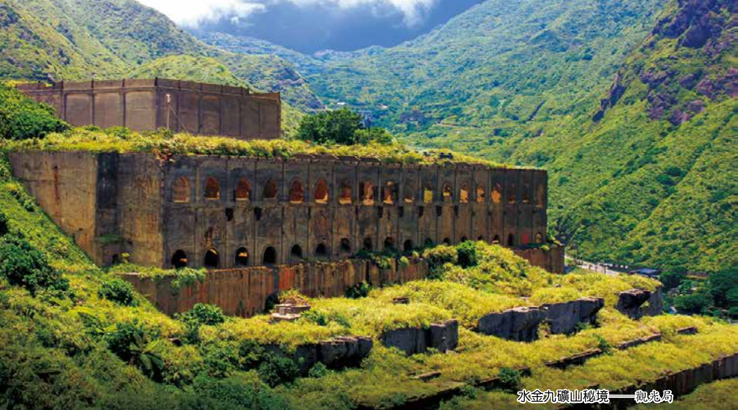
水金九礦山秘境——觀光局