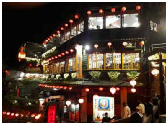
繁華如昔的山城夜晚

當地的重要景點除了十三層遺址之外，還有原名為「濂洞灣」的水湳洞陰陽海、黃金瀑布、五萬噸與煙管、金瓜石車站、大肚美人山、九份老街、基山街、豎崎路等，構成了「水金九礦業遺址」台灣世界遺產候選地。