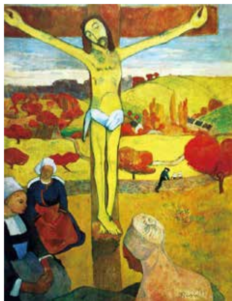
圖 6 《黃色的基督》1889