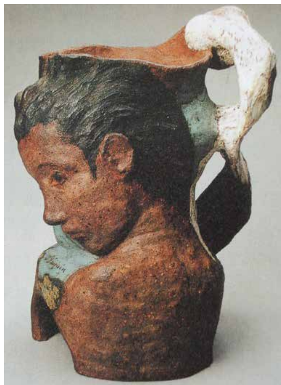
圖 7 《麗達與天鵝》1887-88

真的人或物，利用簡化形狀和顏色，才能清楚的表達他思想中的宗教虔誠。所以繪畫到了他手上，變成描寫主觀強烈的感情，以及神秘與