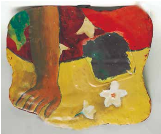
圖 9 《有高更造形元素的设计》張義羚 13 歲