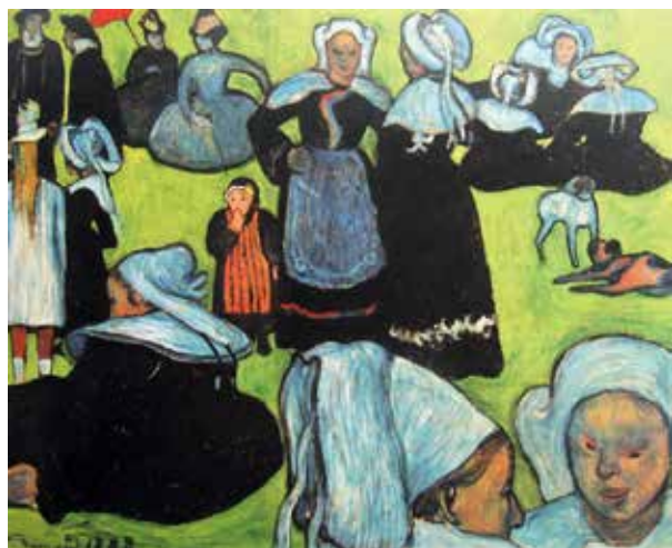
圖 4 貝納《綠色草原上的布列塔尼婦女》1888