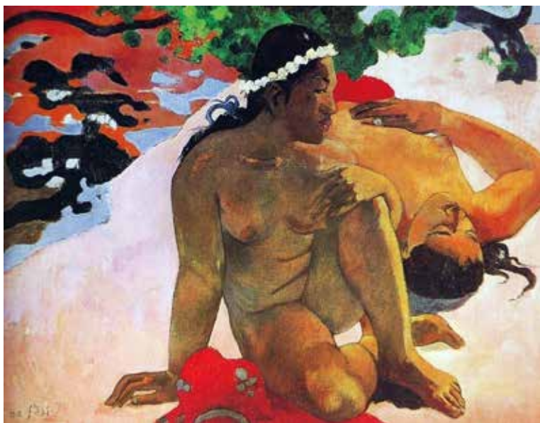
圖 5 《怎麼，你嫉妒嗎》1892