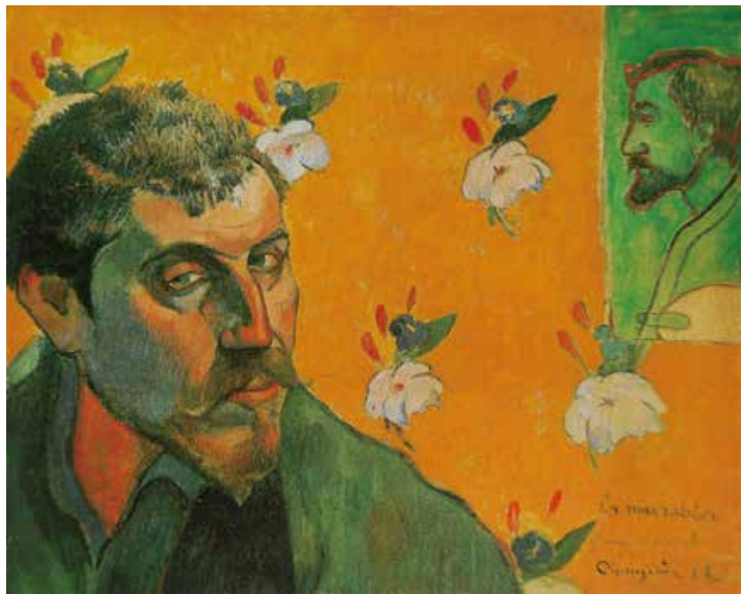
圖1 高更 Paul Gauguin 1848-1903 《自畫像》（悲慘世界）1888