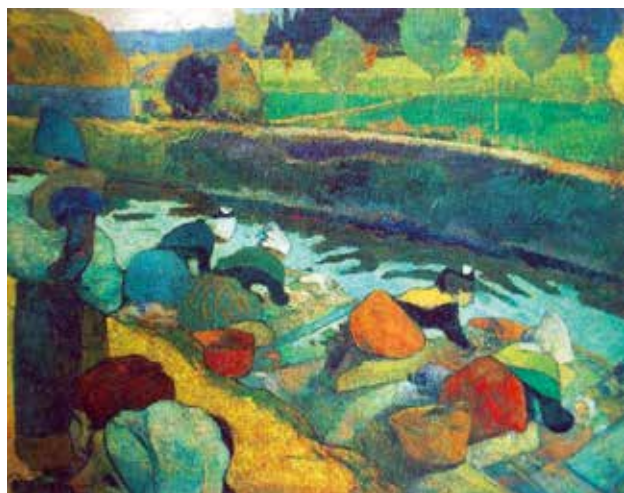
圖 3 高更《阿爾河邊的洗衣婦》1888

從中獲得靈感改變形成新風格 (圖 3)，貝納後來在自己的書中寫著：「自從送了高更我所創作的一幅畫以後，高更的畫越來越像我，而且爭著說自己是象徵主義的創始人。」兩人也