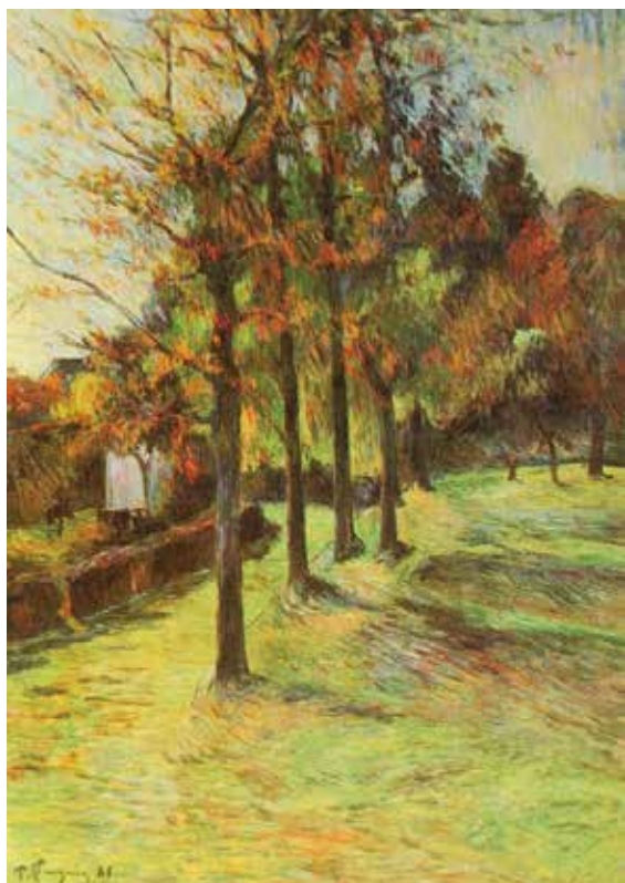
圖 2 《往浮翁的道路 II》1885

高更 34 歲才開始專業畫家生活，40 歲之前努力吸收各門派的藝術特色，他具備高度的文化素養，敏感多能，1888 年之前他都在印象派畫風之間摸索，這年夏天年輕畫家貝納 (Emile Bernard, 1868-1941) 送他一幅名為《綠色草原上的布列塔尼婦女》的畫 (圖 4)，他