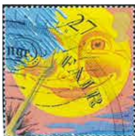
FAIR 有不同的說法 (英國)

比利時 Belgique 於 1954 年 9 月 10 日，發行「國際扶輪 50 週年，歐洲暨奧斯坦德 Ostende（面臨北海的城市）大會」郵票，畫面上有安徒生童話故事的美人魚在左，右有古希臘與羅馬神話中的神使漢米斯 Hermes，兩位各伸展雙手護持著扶輪，童話與神話，引人無盡遐思，看似要說些什麼話？