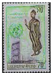
寮國 如來說…世界 非世界是名世界